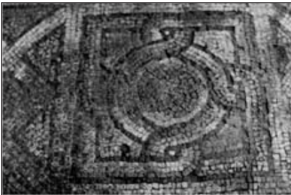
Обр. 3. – Част от ранната мозайка в централния кораб (Кесякова 2011, с. 191)