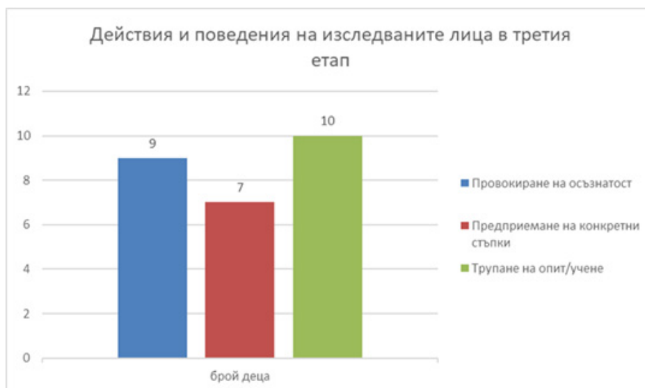
Фигура 4. Действия и поведения

В коучинг подхода могат да бъдат използвани и адаптирани множество инструменти и техники на коучинга, като единственото условие е да бъдат адаптирани към нуждите, опита и знанията на всяко дете поотделно. Друго важно условие е да бъде интегрирана всяка техника, използвайки формата на игра, така че да бъде забавен процес за детето.