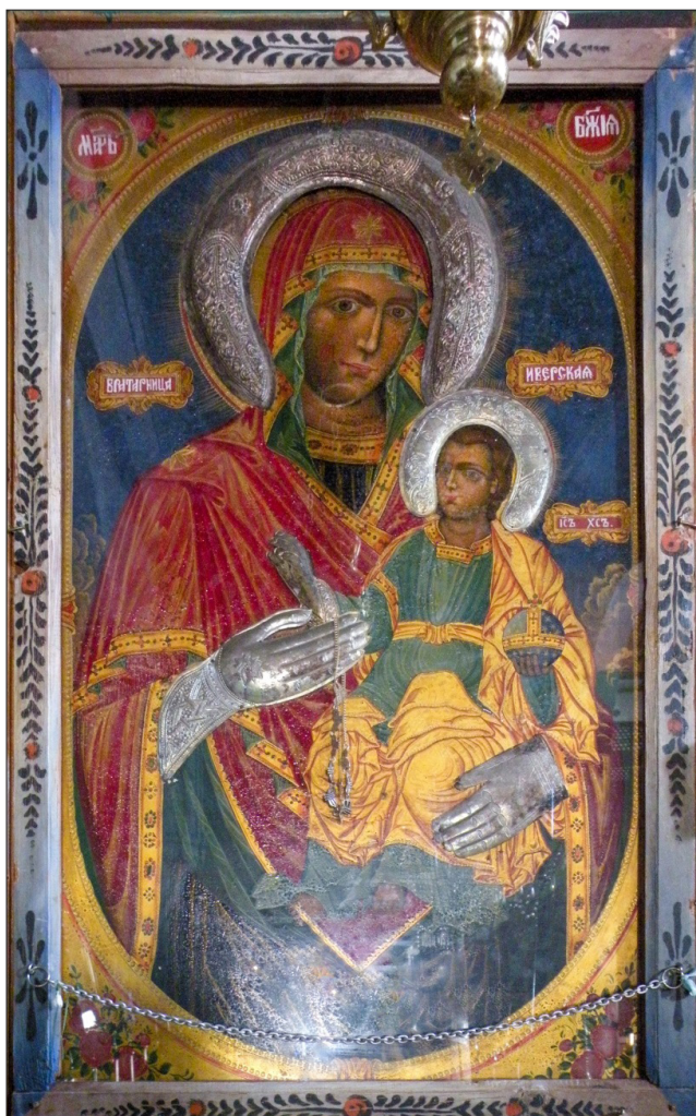
Обр. 7. Иверската икона на св. Богородица с Младенеца от ц. „Св. Йоан Предтеча“ в Мелник

Изключително популярен е култът към Иверската икона на св. Богородица Портаитиса и нейното почитание в региона около Роженския манастир. Пряко доказателство е друго копие на иконата, запазено в мелнишката ц. „Св. Йоан Предтеча“, с надпис: „Вратарница Иверская“ (Обр. 7.) 27 . Според Ем. Мутафов мелнишкият зограф Лазар Петракидис изпълнява това копие. Реплика на чудотворната икона има и в ц. „Св. Димитър“ в с. Тешово 28 .