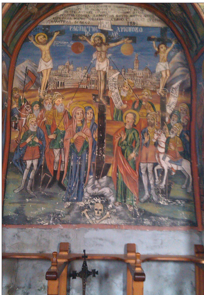
Обр. 1. Стенопис „Разпятие Христово“ от ц. „Св. арх. Михаил“ в с. Лешко