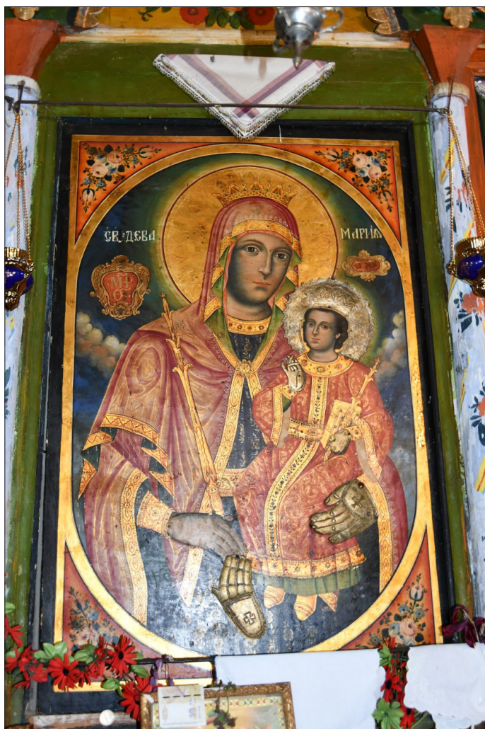
Обр. 11. Иконата „Достойно ест“ в Обидинския манастир

Част от многобройните поклонници на Рилския манастир вероятно са пребивавали и в днешния град Рила, където манастирът е разполагал с активен метох през XVIII–XIX век. Разказът за историята на иконата „Св. Богородица Троеручица“ е трогвал сърцата на богомолците и те желаели да имат и в своите енорийски храмове такава икона, закрилница на тях, семействата им и локалната православна общност. Разпространението на тези реплики на чудотворната икона са сигурно доказателство за близки взаимоотношения и активен култ към тази хилендарска светиня в българските земи и конкретно в разглеждания регион.