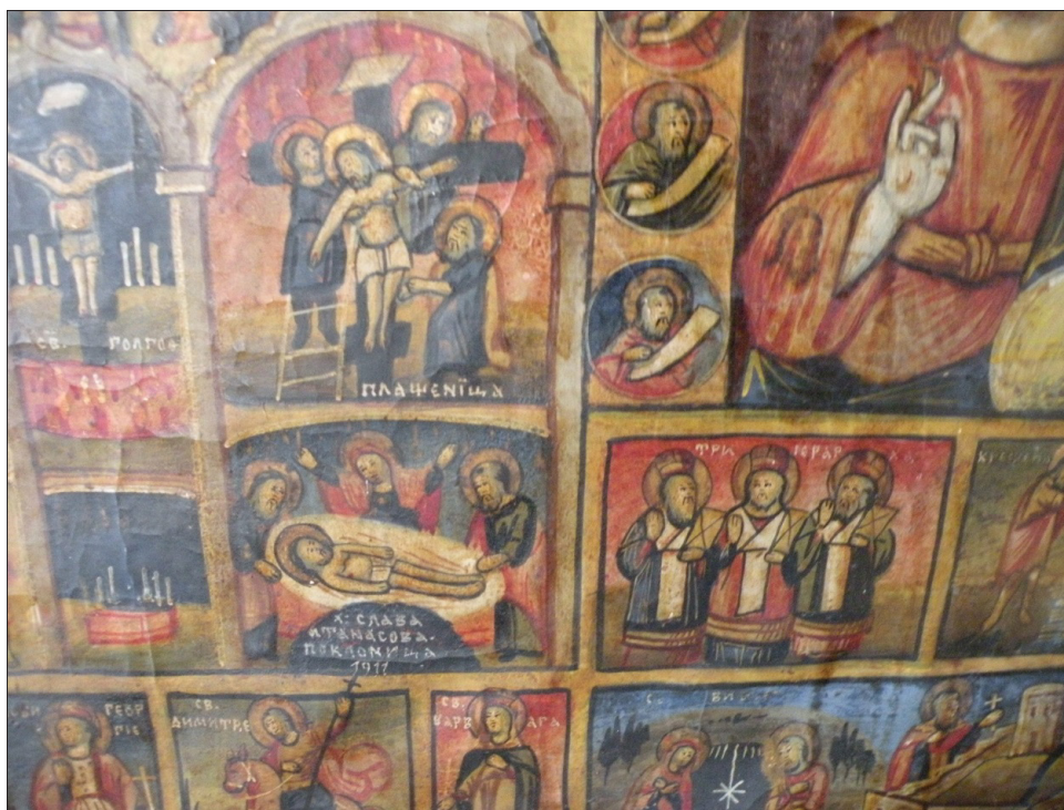
Обр. 3. Йерусалимия от Обидински манастир

По време на теренни проучвания откривам йерусалимия в ц. „Успение Богородично“ в с. Кашина (Обр. 2). За съжаление тя не е в добро състояние и се нуждае от реставрация. При заснемането ѝ дори не си позволихме да я разгънем, за да не нанесем по-големи щети. Ето няколко акцента от иконографията ѝ: в центъра на горния регистър е сцената „Страшният съд“ с пастта на Ада, в медальоните: от лявата страна е „Св. Богородица с Младенеца“, заобиколена от пророци; а отдясно – Христос Вседържител с дванадесетте апостоли. В средния регистър доминира храмът на Гроба Господен с Разпятието, Кувуклията с „Възкресение Христово“ над нея, в долната част на църквата е помазването, както и Жертва Авраамова. Симетрично от двете страни са конните фигури на св. Георги и св. Димитър. В долния регистър са изобразени още сакрални сцени, свързани с Йерусалим: убийството на архидякон Стефан с камъни, разрязването на св. Исая с трион и други. За съжаление е много трудно разчитането на името, но годината е 1831 8 .