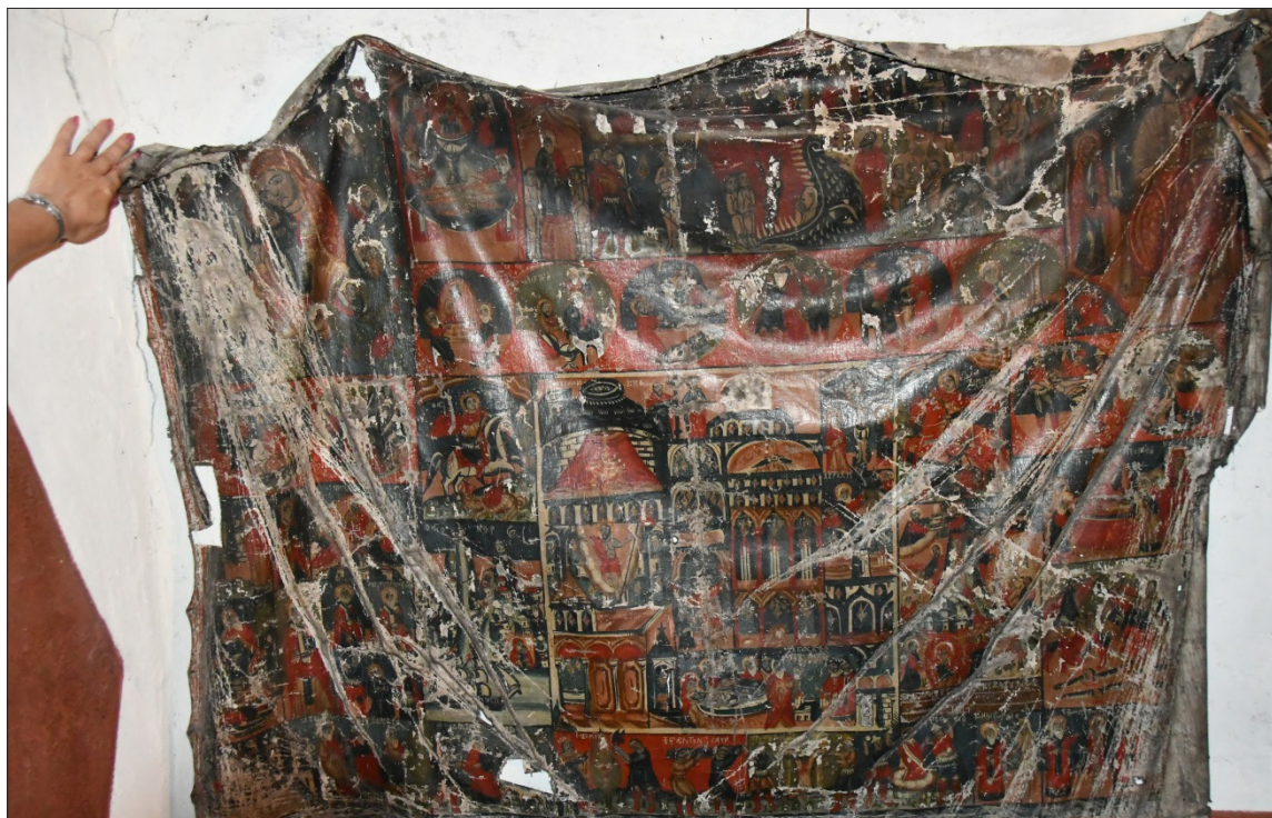
Обр. 2. Йерусалимия от ц. „Успение Богородично“ в с. Кашина

Запазените в българските земи йерусалимии, донесени от Светите земи, се определят като най-важната част от даренията на поклонниците. Те са част от серийното производство на йерусалимските ателиета. Традиционно това са големи изображения върху платно или мушам, улежняващо, от една страна, тяхното пренасяне, а от друга – даващо възможност да се визуализират значителен брой сакрални места, сцени и свети персонажи от Стария и Новия завет 7 .