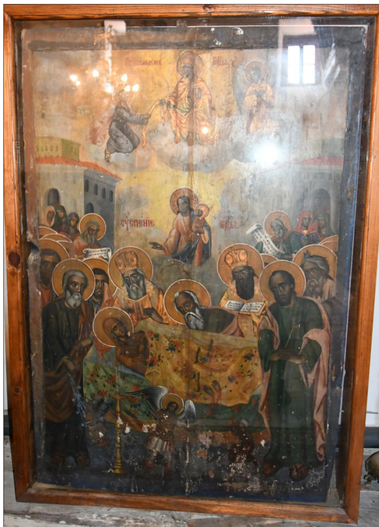
Обр. 9. Вотивни дарове на иконата „Св. Зона“ от ц. „Св. Георги“ в Сидерокастро (Р Гърция)

рява на Ватопедския манастир тази света реликва. Днес част от пояса на Богородица продължава да се съхранява в светогорския манастир и на поклонниците се подарява за здраве едно коланче, престояло до свещената вещ. Неговата чудодейна сила се проявява, ако го носят болни, особено помага на бездетни семейства.