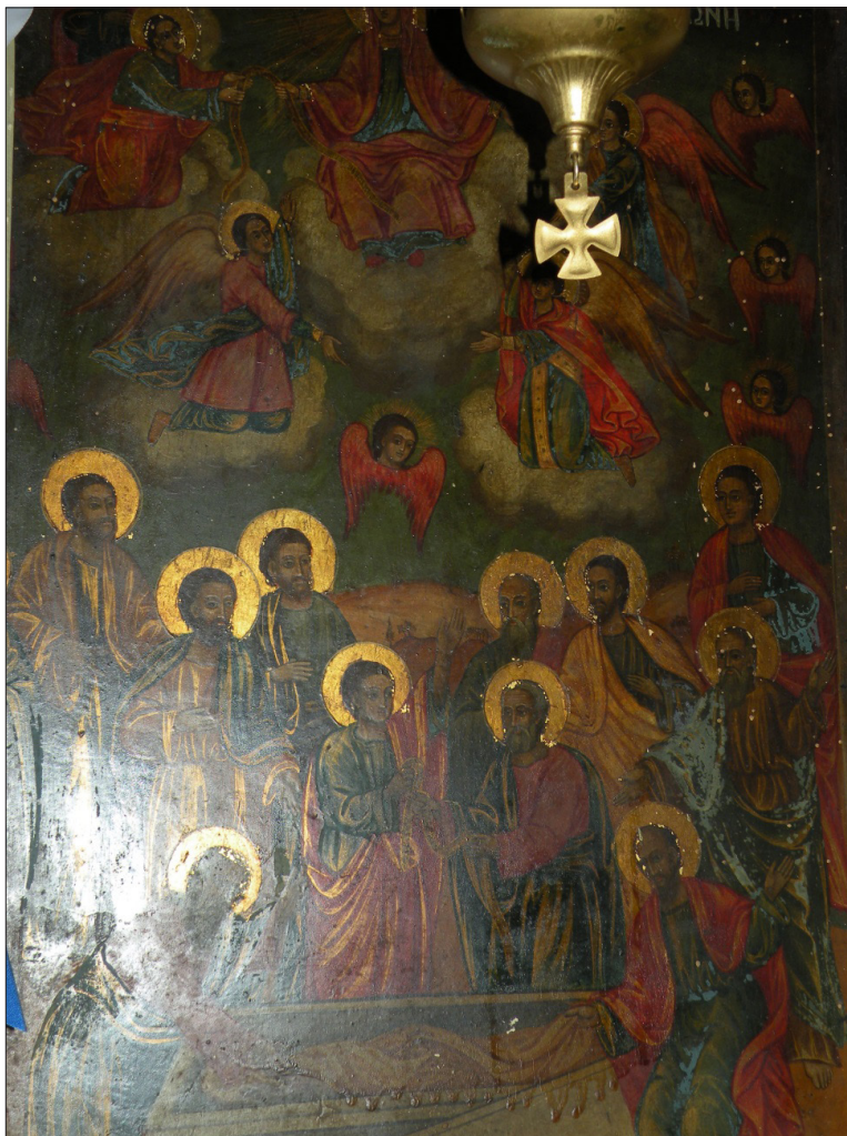
Обр. 10. Иконата „Св. Зона“ от ц. „Св. арх. Михаил“ в Ахридохори (Р Гърция) (българското селище Крушево)

вени конци върху иконата, които по-късно се вземат от болни и бездетни семейства за здраве и лечение 30 .