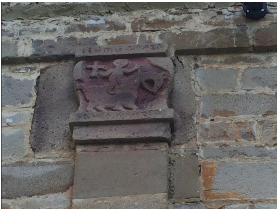
Обр. 5. Каменен релеф от ц. „Св. Георги“ в с. Столът, Габровско

За важноста на поклонническите пътувания до светогорските манастири в българското етническо пространство говори и запазеният релеф върху фасадата на ц. „Св. Георги“ в село Столът, Габровска област. Позволявам си да го посоча, поради факта, че това е единствената визуална каменна интерпретация от този род (Обр. 5.). На релефа е изобразена доста схематична конна човешка фигура, обърната в \frac{3}{4} надясно. Мъжът държи поводите на коня с лявата си ръка, а с дясната – огромен кръст. Над сцената е надписът: „Света гора“, а под нея – името на поклонника.