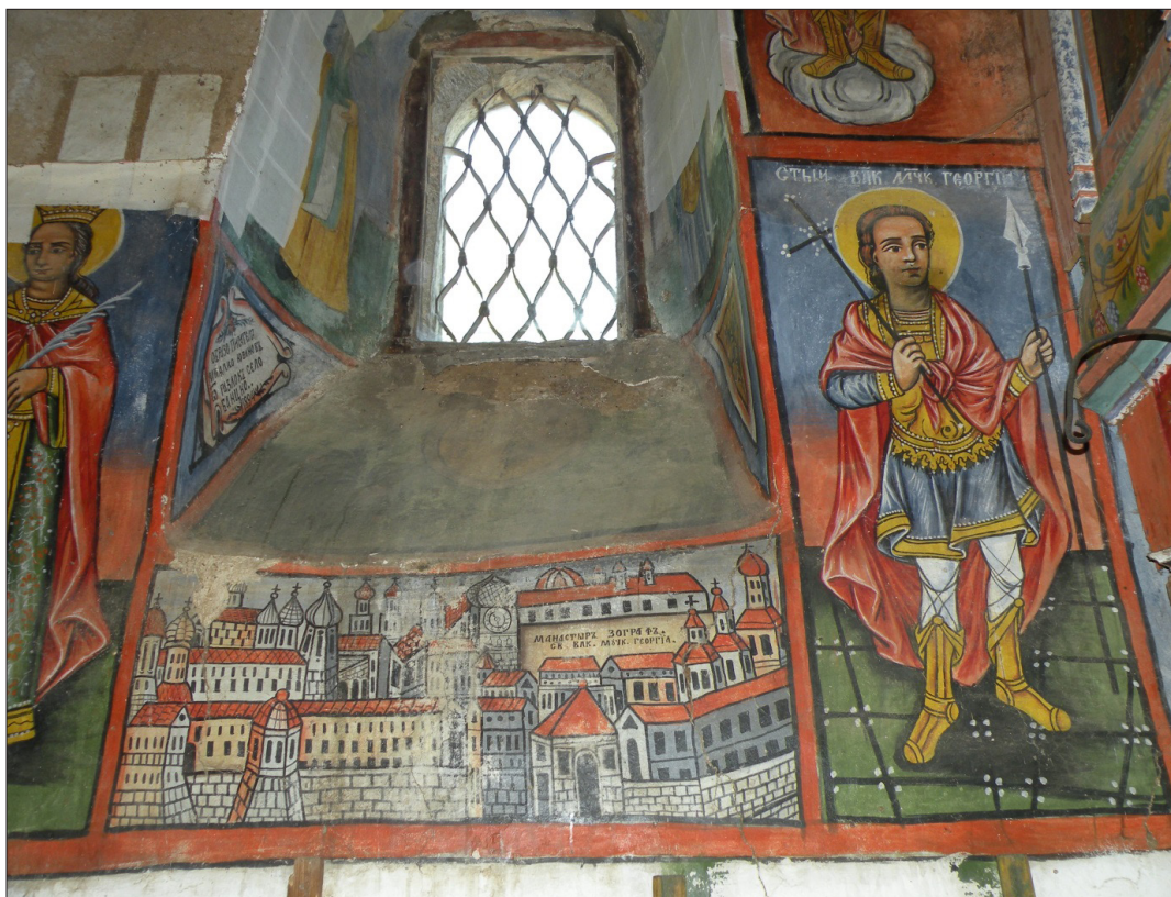
Обр. 6. Стенопис от ц. „Св. Димитър“ в с. Марулево