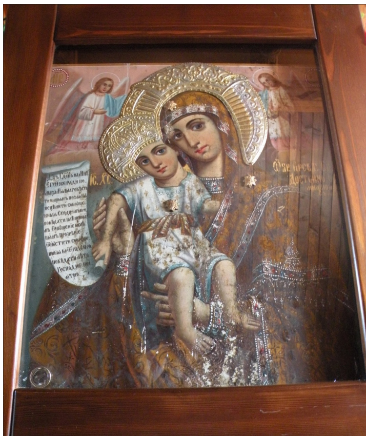
Обр. 11. Иконата „Достойно ест“ в Обидинския манастир

Третата особено почитаема икона в региона е „Достойно ест“, оригиналът на която се намира в главната църква на монашеската столица на Атон – Карея 34 . Едно копие на тази чудотворна икона се пази в Обидинския манастир (Обр. 11.). Репликата е изписана и осветена от руски свещеници пустиннослужители, вероятно от зографското ателие на руския манастир „Св. Панталеймон“. Върху обратната страна на иконата е западен следният надпис от 25 май 1909 г.: „Според жребий чудотворният образ на Небесната царица е предназначен за един манастир в Алтай, но е подарен на новостроящия се манастир „Св. Атанас патриарх Александрийски“ в Македония“. Днес иконата е поставена в наоса на църквата на специален проскинитарий от дясната страна пред иконостаса.