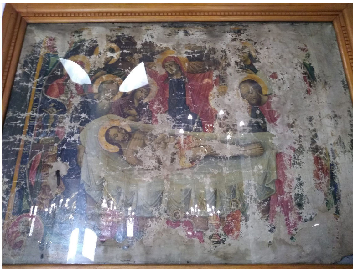
Обр. 4. Плащаница от ц. „Св. ап. Петър и Павел“ в град Добринице