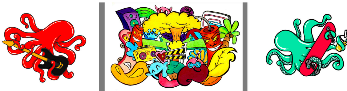
6. Примерни изображения от студентските проекти – детайли

Така подготвено и организирано, събитието има потенциал да увеличи разнообразна публика, която да е участник, а не само зрител. Демонстрират се специфични прийоми за постигане на завършени художествени образи – въздействащи и провокиращи съвременните хора изображения.