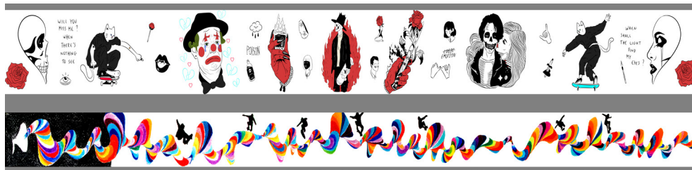
4. Примерни изображения от студентските проекти II