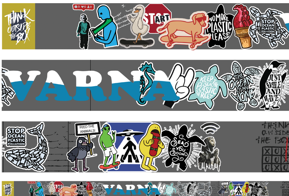
5. Примерни изображения от студентските проекти III

Създаването на проектите и участието в артистичната акция по реализирането са разностранни процеси, които адмират креативността като двигател на иновации, увличат различни групи от социума и стимулират активността на участниците и публиките. Проектът насърчава взаимодействието между партньорите, между професионалистите и публиката, създава връзки в културен, социален и институционален контекст. Целта на проекта е да предостави на млади хора (16 до 35 г.) с интереси във визуалните и другите изкуства възможност да се учат и работят заедно. Следва реализирането на артистичен пърформанс пред широка публика – акция по рисуване и създаване на относително траен визуален продукт, който впоследствие периодично би могло да бъде обновяван и окрупняван, обединяван с други сходни по замисъл събития и дейности. Мотивацията на по-голямата част от участниците/изпълнители в проекта е любовта към изобразителното изкуство и стремежът за изява и създаване на произведение с обществен мащаб и разгласа. Това спомага за формирането, възпитаването и изграждането на публика с ценностни качества и интереси към определен вид изкуство. По време на подготвителната и крайната фаза на проекта ще се рекламират: 1) предстоящото събитие; 2) процесът на подготовка на проектите; 3) процесът на организиране на артакцията.