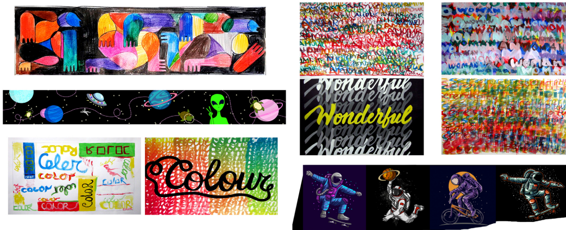
3. Примерни изображения от студентските проекти I