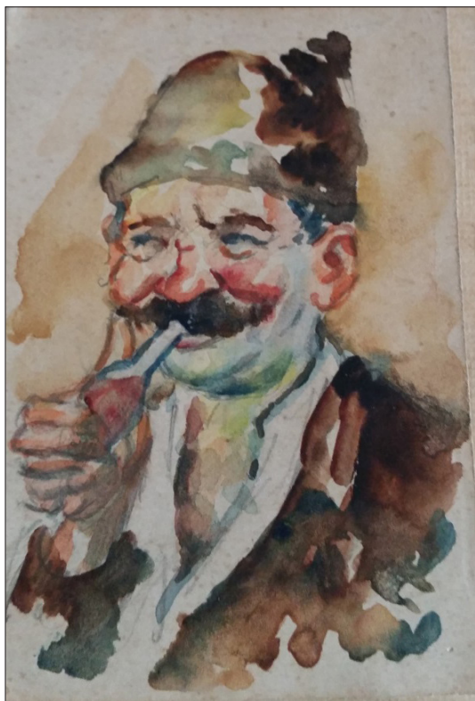
2. Автор: Христо Явашев. Рисулка

портрети, факт, отбелязан в спомените на негови състуденти и приятели от казармата, като Павел Койчев, Светлин Русев, Георги Дойнов, Драган Немцов и др. Както е известно съществуват данни, цитирани в публикации, репортажи и филми, посветени на Христо и неговите, първи години зад граница, от които става ясно, че за известен период той се издържа, рисувайки портрети по поръчка. Всъщност една от публично известните версии за неговите чести посещения във френската легация в София е, че той рисува портрети на семейството на високопоставения дипломат.