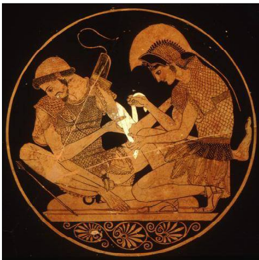
Обр. 1. Ахил превързва ранения Патрокъл. Тондо на червенофигурен киликс от художника Созий от ок. 500 г. пр. Хр. Staatliche Museum in Berlin. INV: F2278.