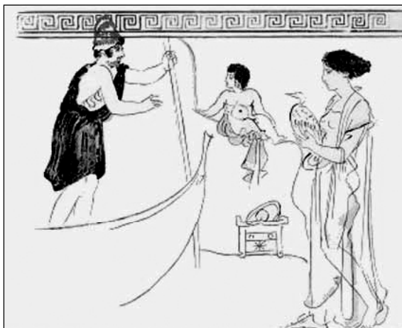
Фиг. 3. Харон, който получава дете. Явно, заплащането е с птица/гъска, а не с монета.