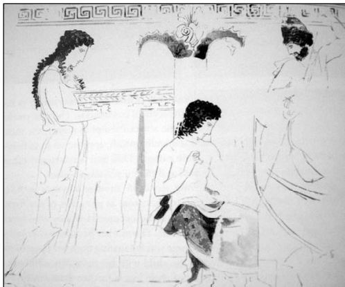
Фиг. 5. Мъртвец, който заплаща своя обол на Харон. Атически лекит, ок. 420 г. пр.Хр.