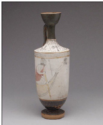
Фиг. 4. Бял атически лекит. Харон и Хермес с кадудей. Приписван на Sabourff Painter. Ок. 450 г. пр. Хр.