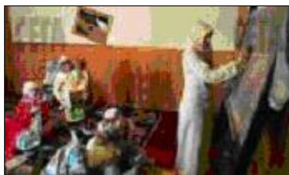
Джамия в с. Рибново