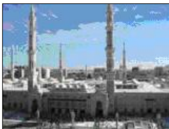
Джамията на Пророка в Медина

След поредица от атентати, организирани и извършени от ислямската групировка „Ал-Каида”, въпросът за ролята и мястото на джамиите в съвременното общество става все по-дискутиран и актуален. В много западноевропейски държави като Великобритания, Германия, Франция, крайно десните националистически партии започнаха кампании срещу построяването на нови джамии и организираха атаки срещу вече съществуващи. През последните няколко години тази тенденция се проявява и в България – все по-многобройни стават протестите срещу строежи на джамии в градовете София, Бургас, Стара Загора, Хасково и други. Причините за тези действия се крият в неясния произход на източниците на финансиране и предполагаемата роля на джамиите като центрове на ислямския фундаментализъм и школи за обучение на терористични групи. Към това се прибавят и намеренията на мюсюлманските общности да се изградят не само джамии, а ислямски центрове – още едно доказателство за все по-силната политическа роля на ислямските молитвени домове.