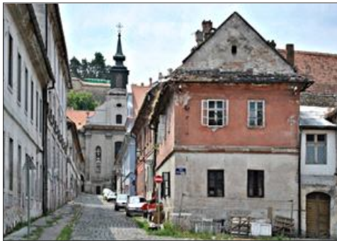
Слике бр. 4-7. Објекти у споредним улицама Подграђа Петроварадинске тврђаве