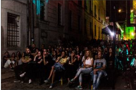
Слике бр. 10–13. Подграђе за вријеме трајања манифестације „Градић фест“ 2017. године