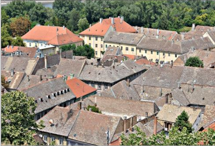
Слика бр. 2. Поглед на Подграђе са Петроварадинске тврђаве.