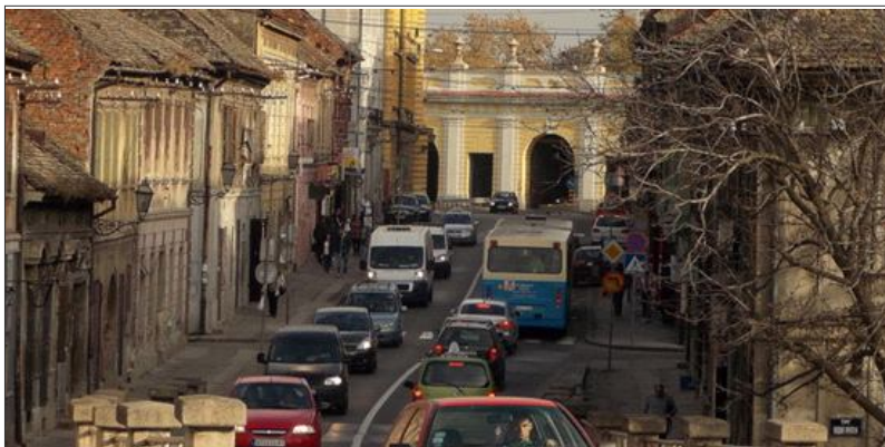
Слика бр. 3. Саобраћај у главној улици у Подграђу Петроварадинске тврђаве

Генералним урбанистичким планом града Новог Сада из 2001. године, овај дио Петроварадинске тврђаве, означен је као центар, што би требало да значи да има одговарајућу јавну и пословну функцију, са много више пословних, угоститељских, занатских и трговинских садржаја. Посљедњих неколико година, уочавају се значајније промјене, што показују и подаци приказани у претходној табели, гдје се број пословних објеката у приземљима зграда цивилног дијела Подграђа многоструко увећао. Тако од укупног броја пословних простора, који објективно постоје на терену њих 27, што чини око 80% је активно и врши пословну функцију. Ван пословне намијене налази се 7 пословних простора, који су у ранијем периоду били активни.