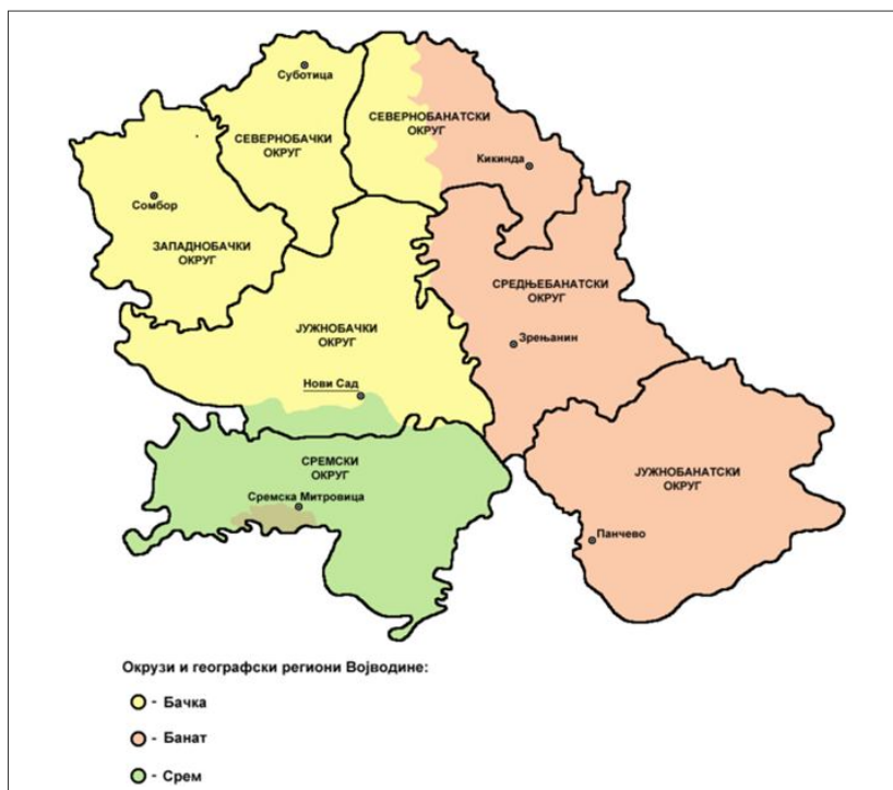
Карта 1. Региони Војводине са регионима и окрузима