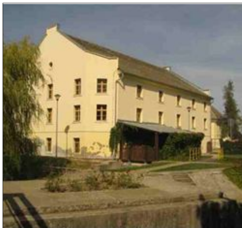
Слика 1. Млин у Малом Стапару (општина Кула)