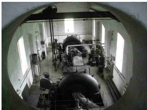
Слика 3. Црпна станица „Плавна” (општина Бач)