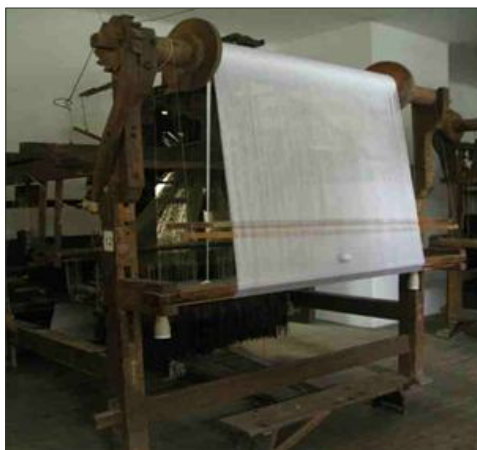
Слика 2. Детаљ из ткачнице у Бездану (општина Сомбор)