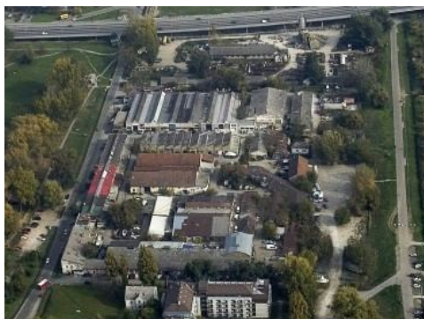
Слика 4. Стари индустријски комплекс („Кинеска четврт”) у Новом Саду