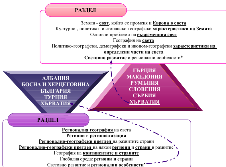
Фиг. 2. Ситуационен синтез по наименование на раздел за обучението по география на страните

При десет от страните в учебната програма се съдържа наименованието на раздела , с изключение на Черна гора, където не се съдържа конкретно наименование на обучението за страните. Наименованията на разделите съдържат ключови думи и фрази, които пряко кореспондират със съдържателната рамка по регионална география. По този критерий страните могат да бъдат групирани в две групи, като границата е изключително условна, защото всички единични и съставни географски понятия са част от обектно-съдържателната същност на обучението за страните (Фиг. 2).