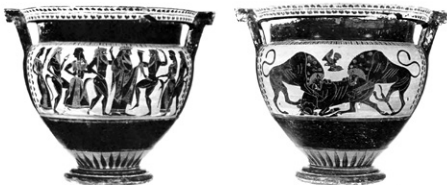
Кратер с изображения на Дионис и неговата свита (страна А) и два лъва разкъсват бик (страна Б). VI век пр. Хр.. Колекция на Музея за древно изкуство в Мюнхен.