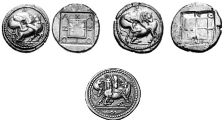
Монети на град Акант с изображения на лъв, разкъсващ бик. V–IV век пр. Хр.