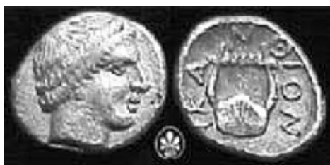
Монета на град Акант с Аполон и лира. V–IV век пр. Хр.