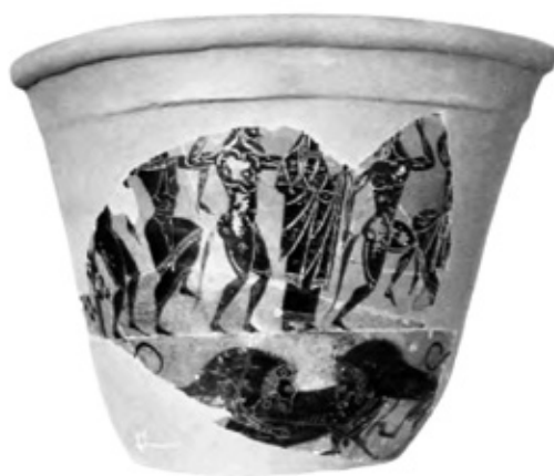
Кратер с изображения на Дионис и неговата свита и два лъва разкъсват бик. VI век пр. Хр.. Колекция на Лувър.