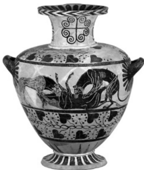
Хидрия с изображение на лъв и леопард разкъсващи бик. VI век пр. Хр. Колекция на Британския музей.