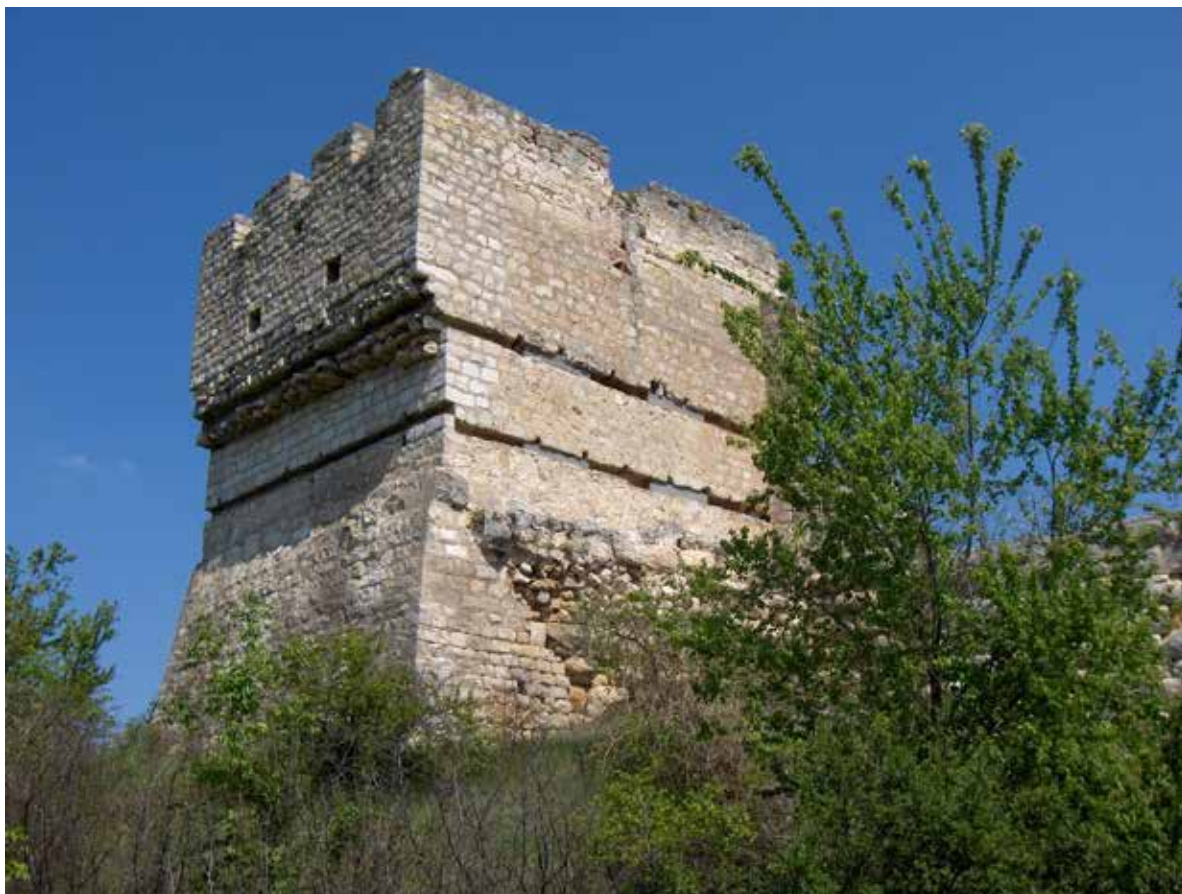
Обр. 2. – Средновековният Червен