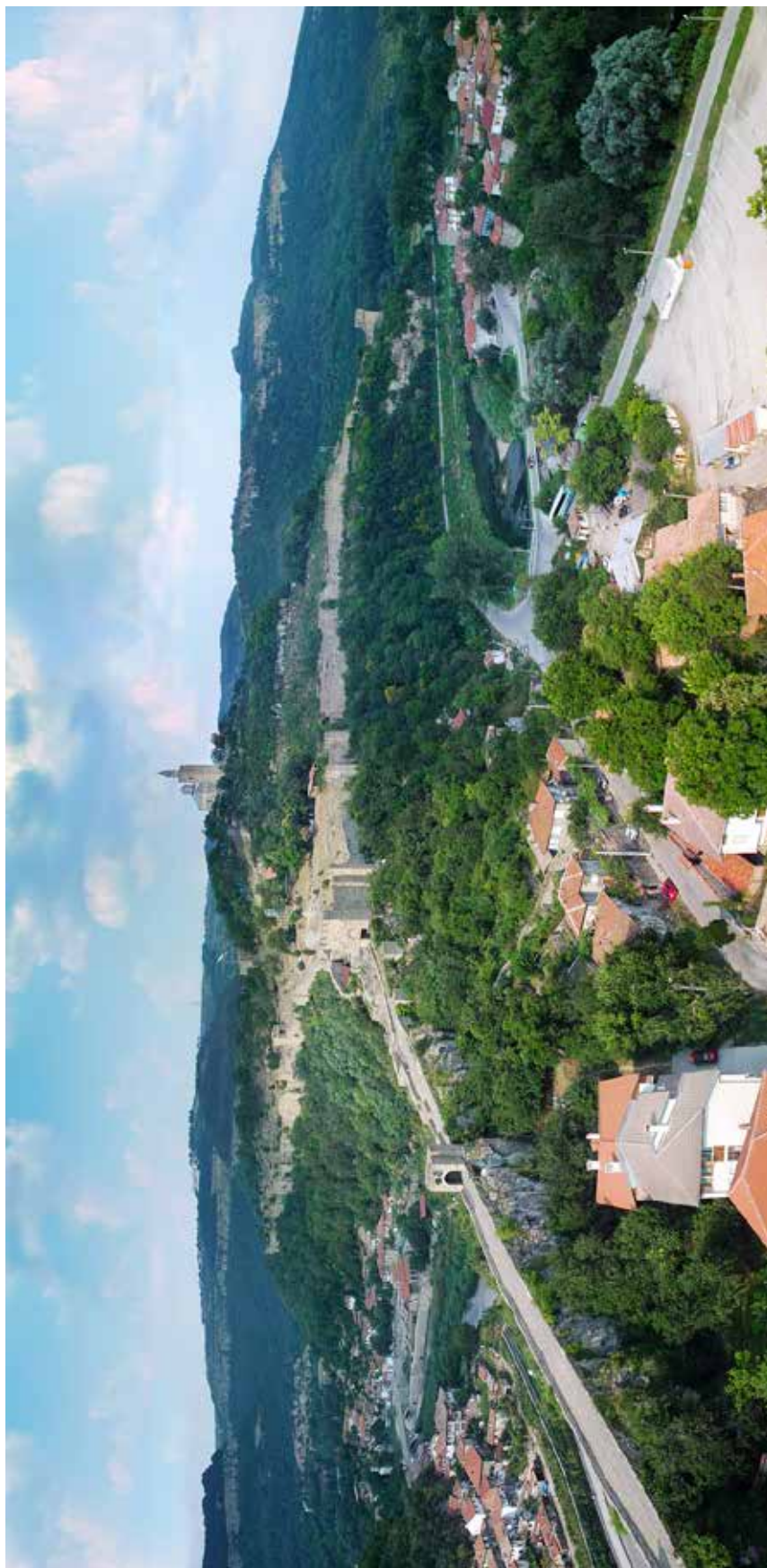
Обр.1. – „Царственият Гърновград“