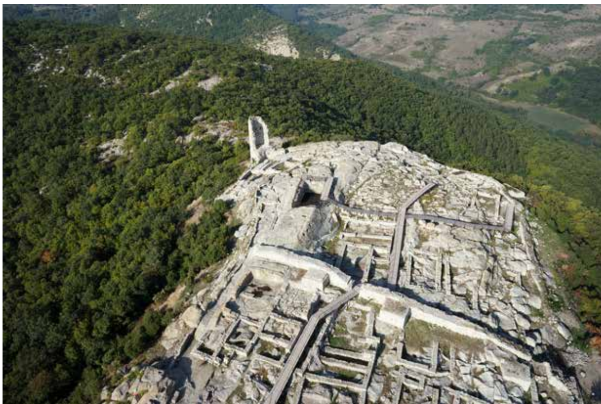
Обр. 3. – Перперикон от въздуха