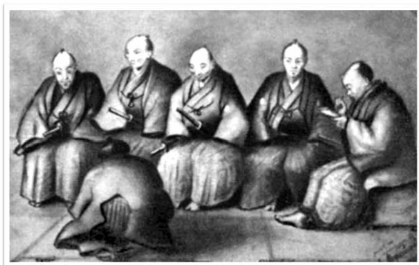
(Рис.6.) Японские уполномоченные во время переговоров о торговом трактате с генерал-адъютантом Путятиным в Симодэ (Япония) в декабре 1854 года (по рисунку лейтенанта А.Можайского – будущего пионера авиации). Русский художественный листок, № 14, 1857.