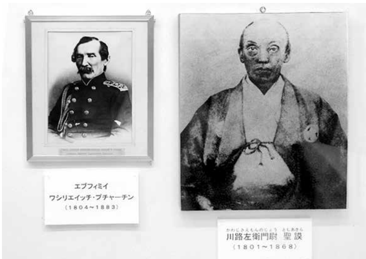
(Рис. 4.) Евфимий Путятин и Кавадзи Тосиакира, подписавшие Симодский трактат между Россией и Японией в 1855 году. Экспозиция Музея в Хэда (Shipyard and Suruga Bay Deep-Sea Museum).