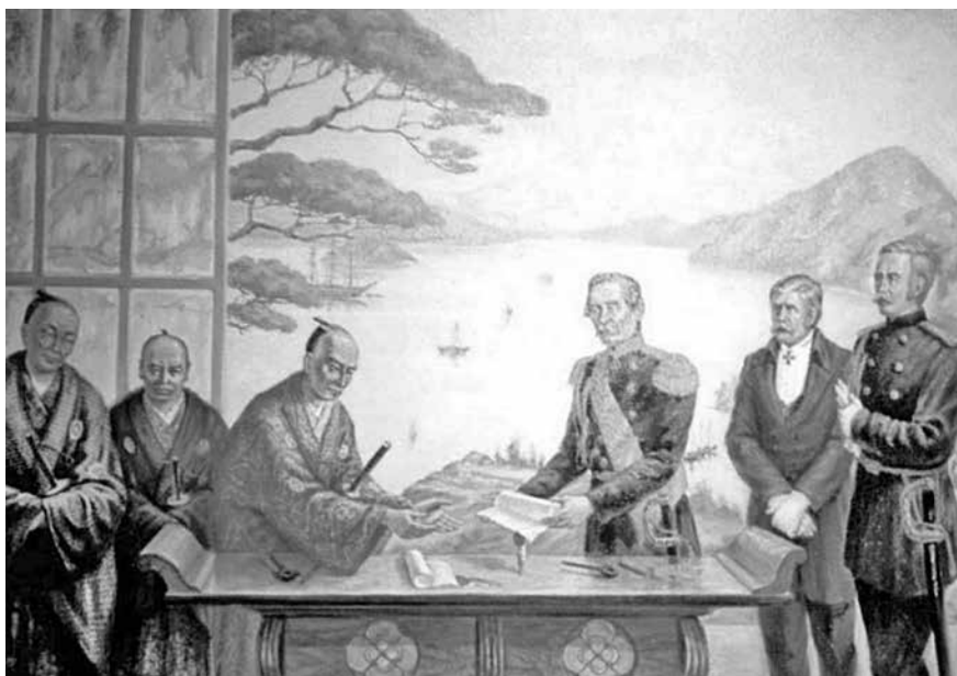
(Рис. 1.) Подписание Симодского трактата о мире и дружбе между Россией и Японией, 1855 год. В центре – Евфимий Путятин и Кавадзи-саэмондзэ Тосиакира. Картина неизвестного художника.