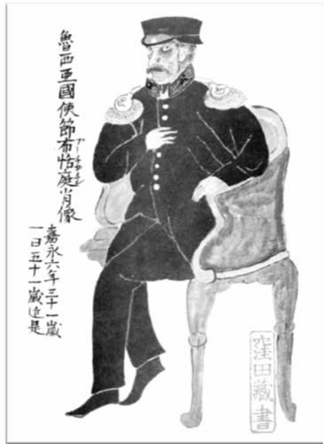
(Рис. 3.) Портрет Е.В. Путятина, написанный Эгоси Айкитиро, одним из свиты Кога Кинъитиро.