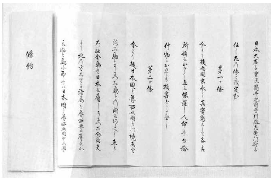
(Рис. 2.) Симодский трактат. Экспозиция Музея в Хэда (Shipyards and Suruga Bay Deep-Sea Museum).