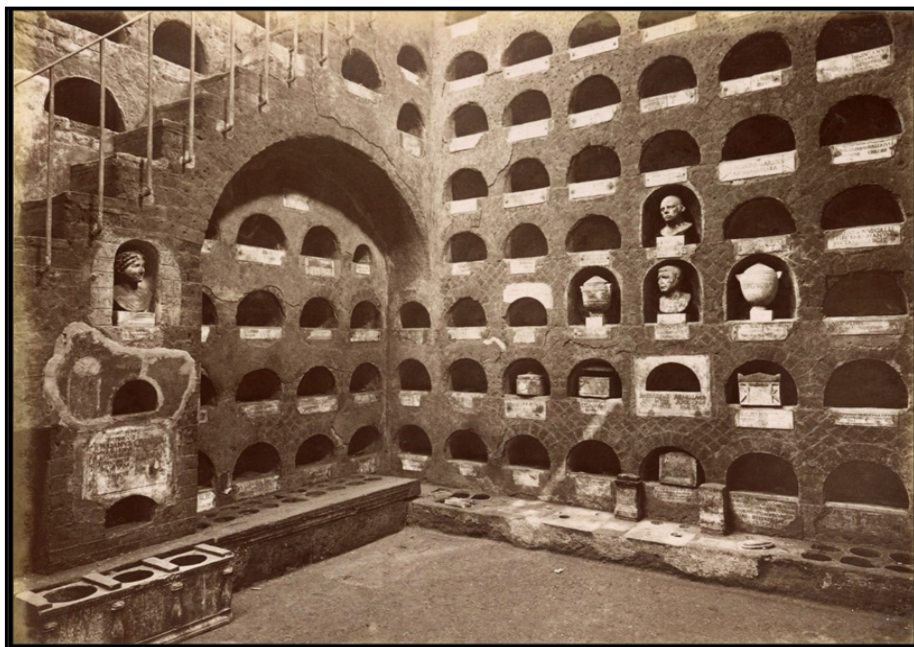
Обр. 13. – Колумбариумът на Vigna Codini** в Рим, принадлежащ на Юлиево-Клавдиевата фамилия и използван до края на II в. сл. Хр. за погребване на останките на някои от техните роби