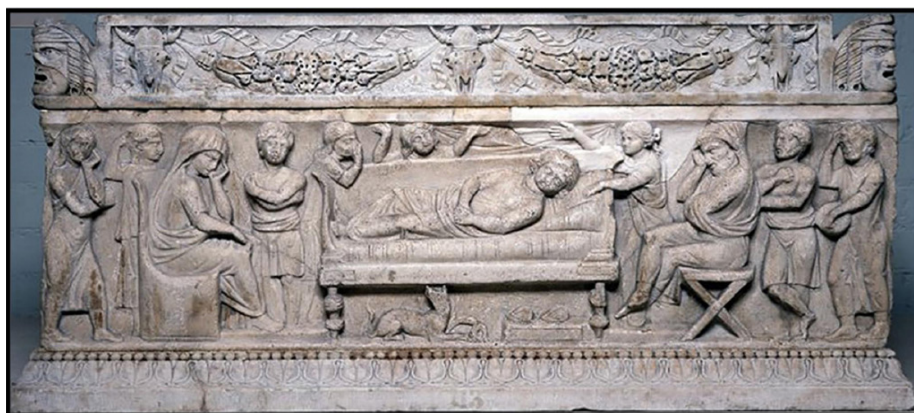
Обр. 2. – Conclamatio – релеф върху саркофаг, 200 – 220 г. сл. Хр., Бритиш музеум, Лондон