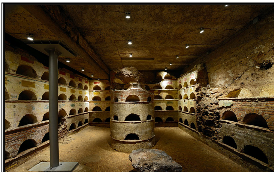
Обр. 14. – Колумбариум в близост до гробницата на Сципион на Виа Апия в Рим, I в. сл. Хр.