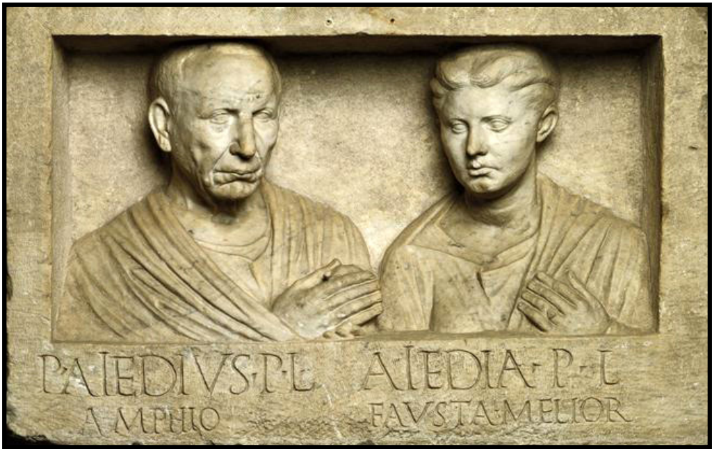
Обр. 16. – Римска надгробна стела на Publius Aedius Amphio и неговата съпруга Aiedia