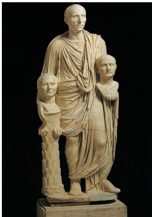
Обр. 8. – Мраморна статуя на римски сенатор, носещ бюстовете на двама от предците си, т.нар. Togatus Barberini, Рим, Капитолийски музей, I в. пр. Хр., Инв. № МС 2392