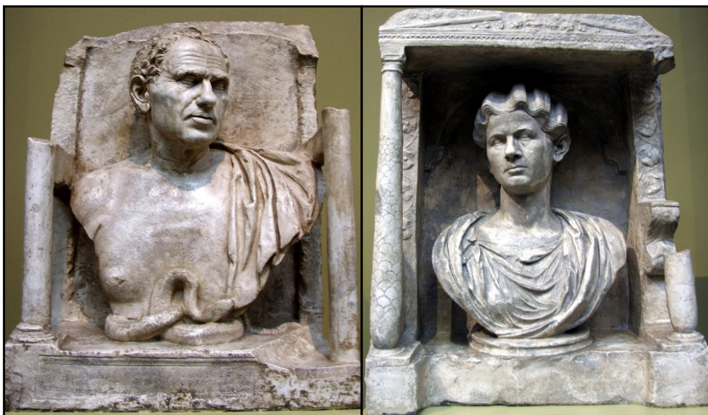
Обр. 7, 7-а. – Бюстовете на Quintus Haterius и неговата съпруга Vipsania Marcella