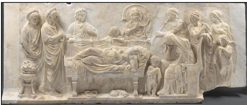
Обр. 3. – Conclamatio – релеф, II в. сл. Хр., Musée du Louvre, Paris, Inv. MR 1641