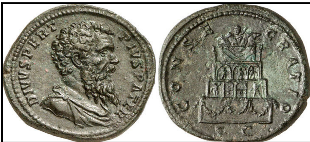
Обр. 9. – Сребърна монета с изображение на Пертинакс (192 – 193) на аверса и неговият устринум (погребална клада) – на реверса