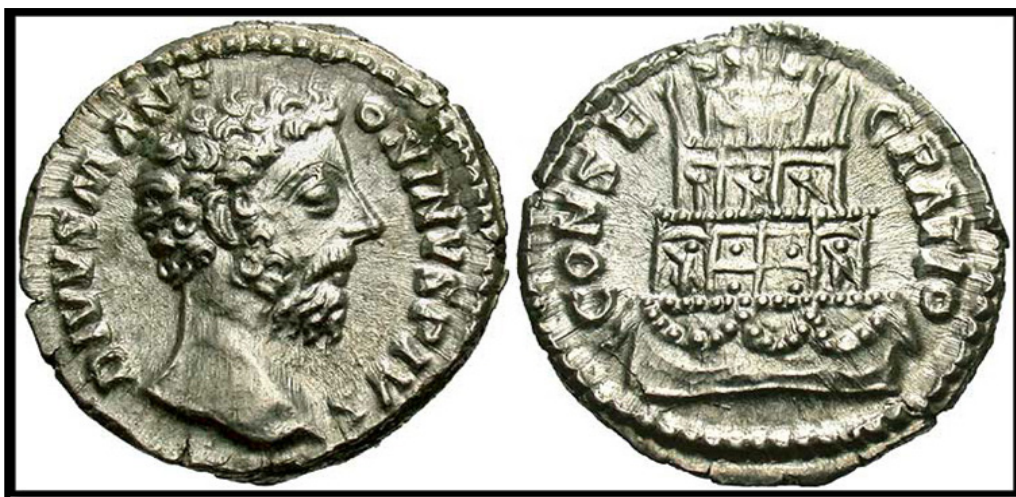
Обр. 12. – Сребърна монета с изображение на Марк Аврелий (161 – 180) на аверса и неговият устриnum (погребална клада) – на реверса