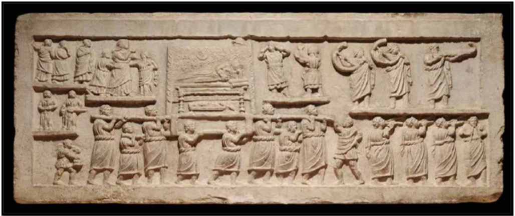
Обр. 5. – Погребално шествие ( exsequiae ) – релеф върху саркофаг от Амитернум, I в. сл. Хр., Museo Nazionale d’Abruzzo, L’Aquila, Abruzzo