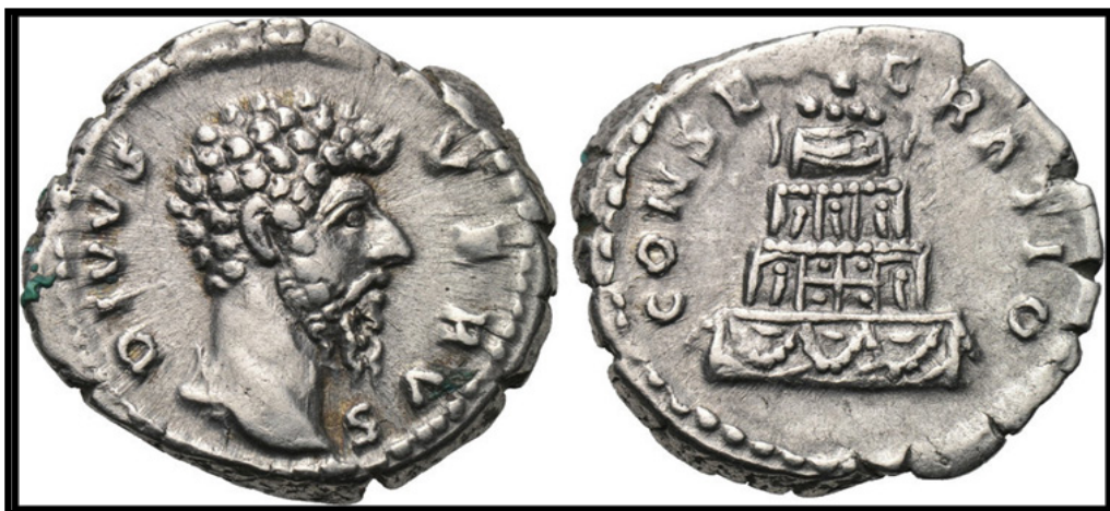
Обр. 11. – Сребърна монета с изображение на Луций Вер (161 – 169) на аверса и неговият устриnum (погребална клада) – на реверса