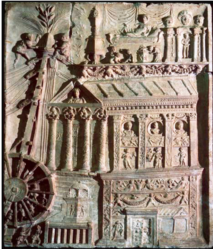
Обр. 6. – Релеф от гробницата на Хатерите – ок. 110 г. сл. Хр., Ватикански музей, Рим