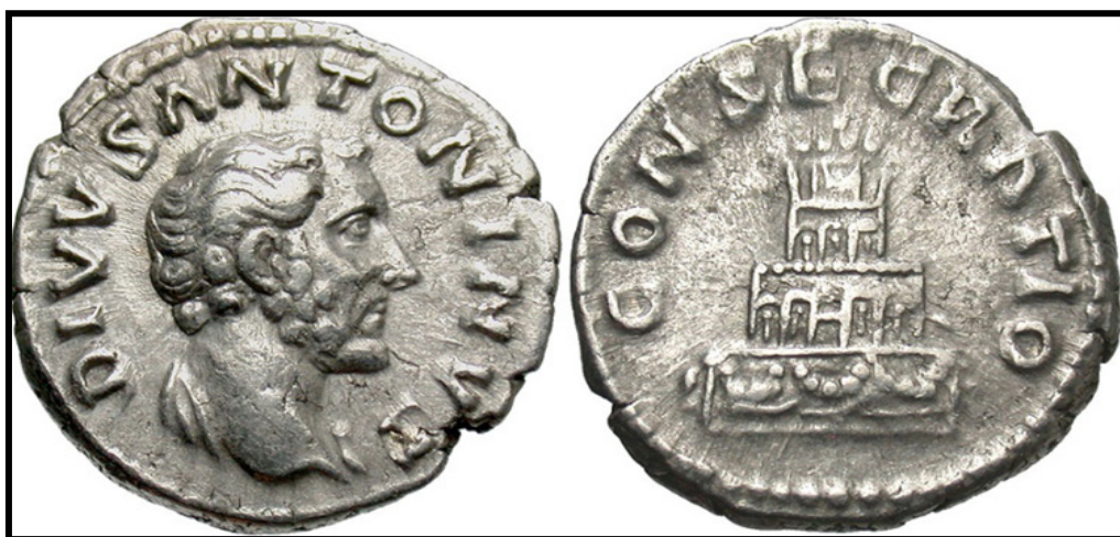
Обр. 10. – Сребърна монета с изображение на Антонин Пий (138 – 161) на аверса и неговият устринум (погребална клада) – на реверса