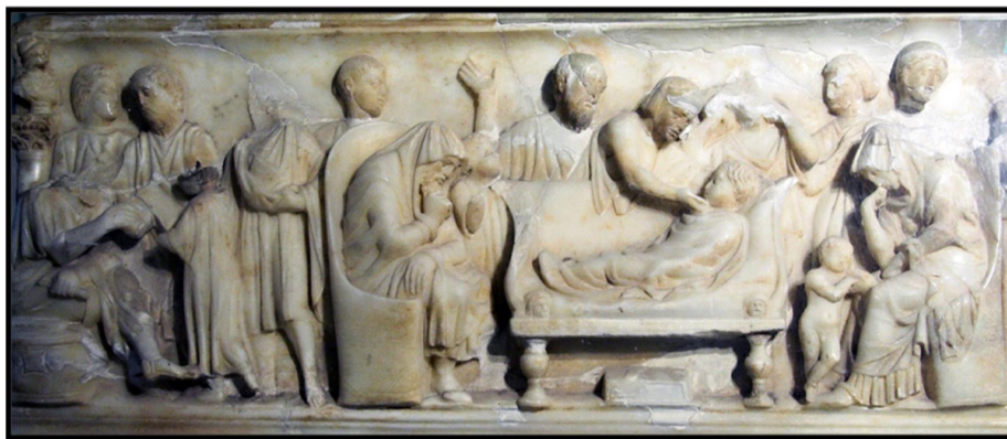
Обр. 1. – Conclamatio – релеф върху саркофаг, II в. сл. Хр., Регионален Археологически музей в Агригент